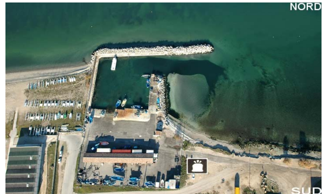
Port du Jai/Marignane