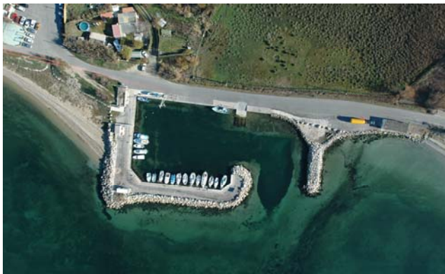
Port du Sagnas/Saint Chamas