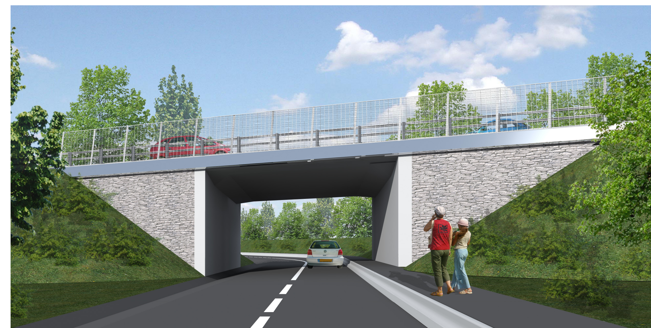
OUVRAGE D'ART OA8 - La déviation passe sur les voies secondaires rétablies