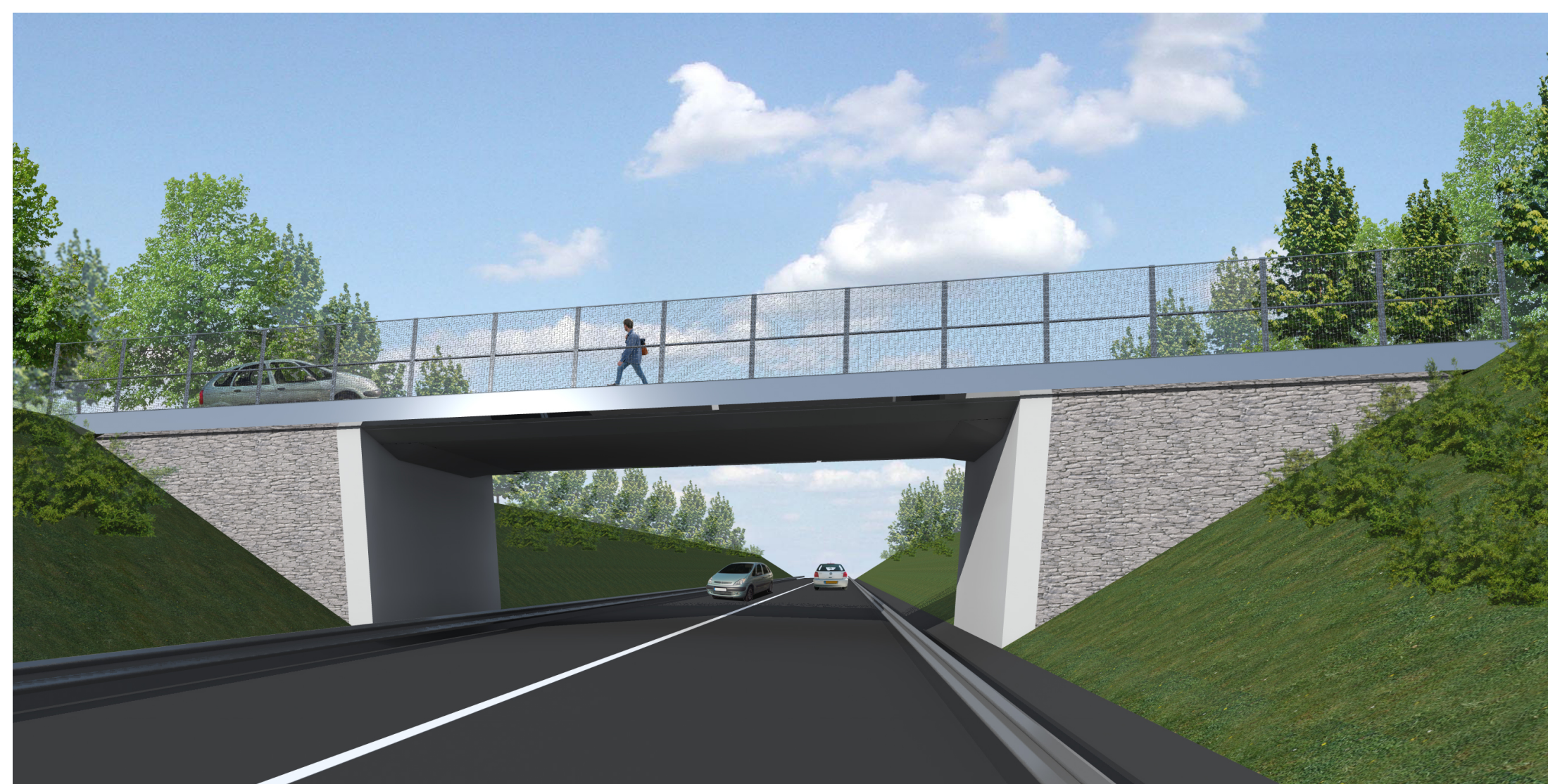
OUVRAGE D'ART OA5 - La déviation passe sous les voies secondaires rétablies