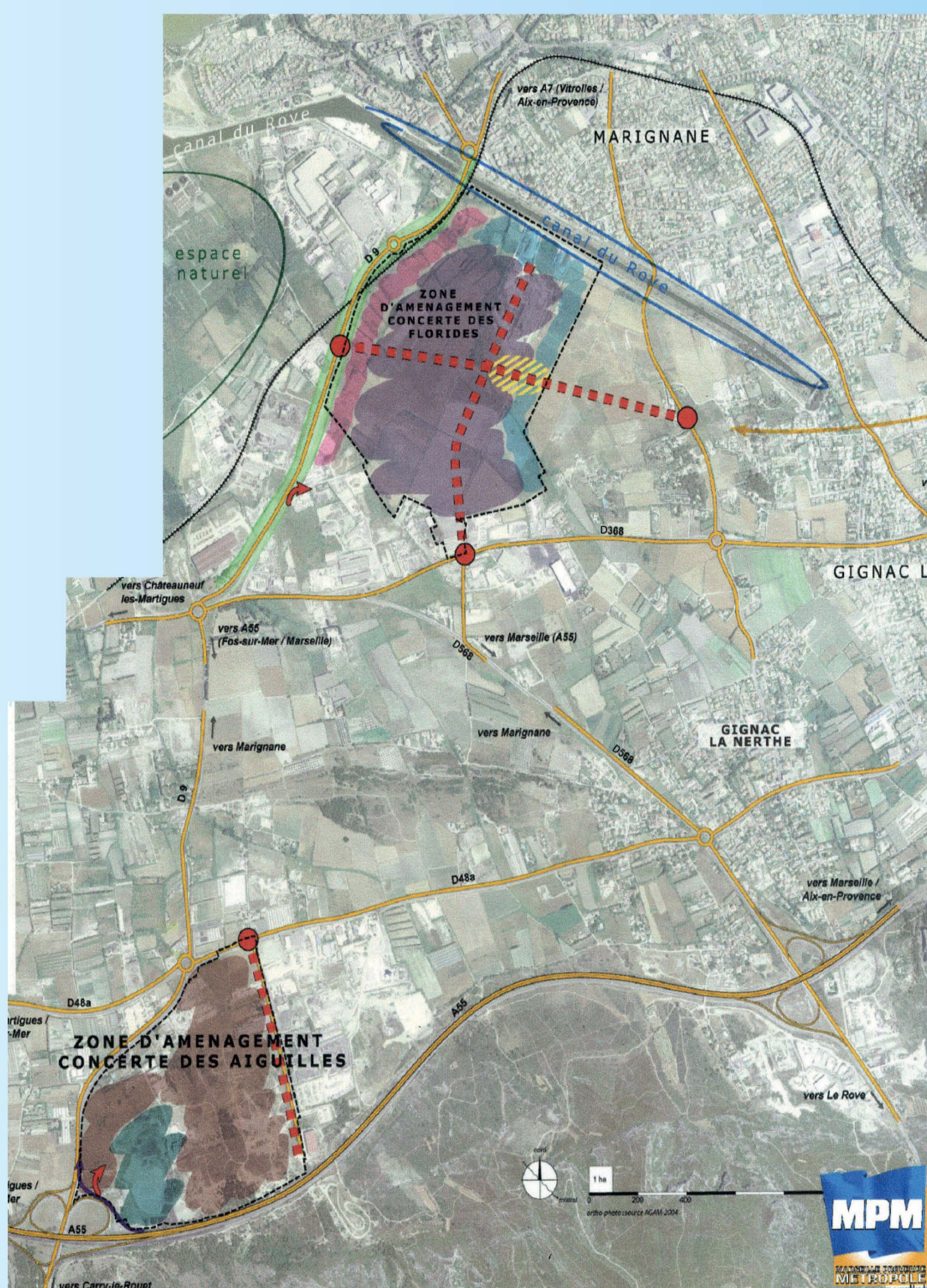
Projet d'aménagement des ZAC des Aiguilles et de Floride

L'ambition voulue pour le futur Parc des Aiguilles est de créer un relais logistique à l'échelle de la Communauté Urbaine. L'ouverture de ces nouveaux espaces économiques va offrir des opportunités de développement aux entreprises de la Communauté Urbaine, tout en permettant d'attirer et d'accueillir de nouvelles activités. Cette valorisation économique permettra à terme la création d'emplois pouvant répondre à la demande locale.