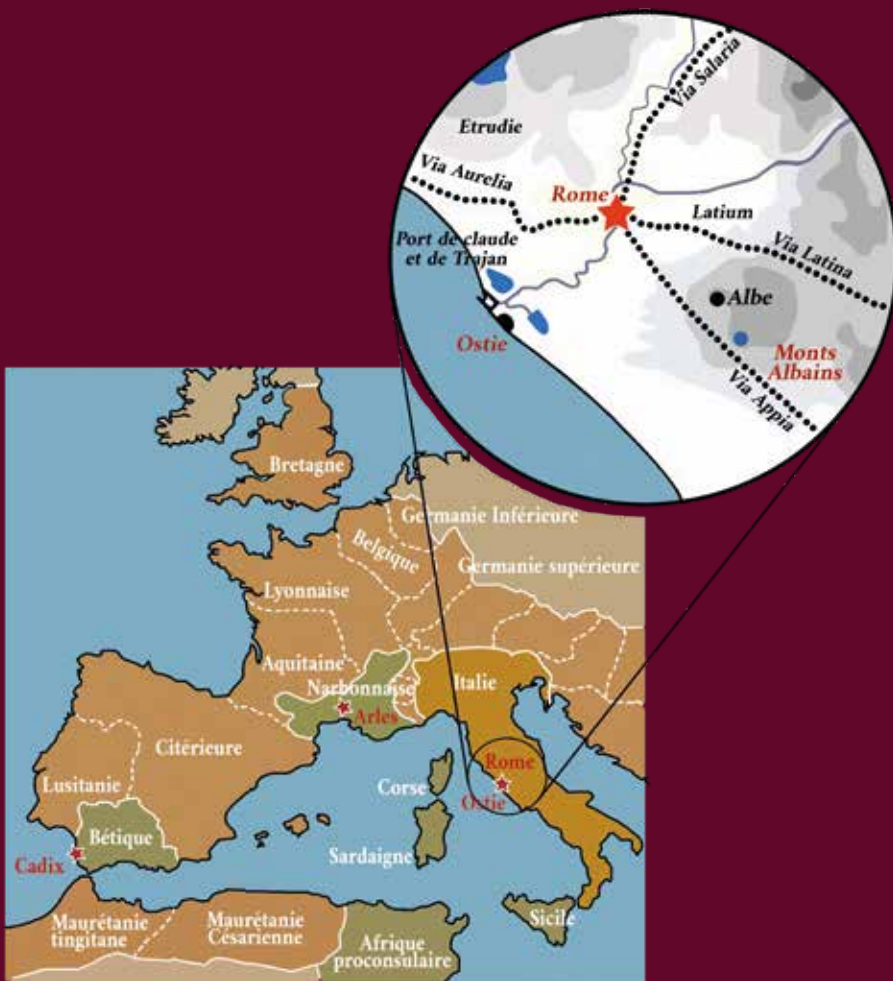
Carte des pérégrinations de Valerius Proculus (© Mourad El Amouri, modifié par Laurent Sieurac)

Ces trois histoires, situées entre Rome, Arles et Cadix, ont été imaginées à partir de l'étude du matériel archéologique issu des fouilles du Rhône.