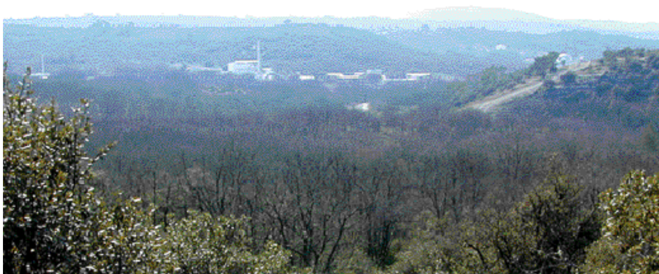
Le site de Cadarache depuis la RD 11a en avril 2005 (prise de vue réelle)