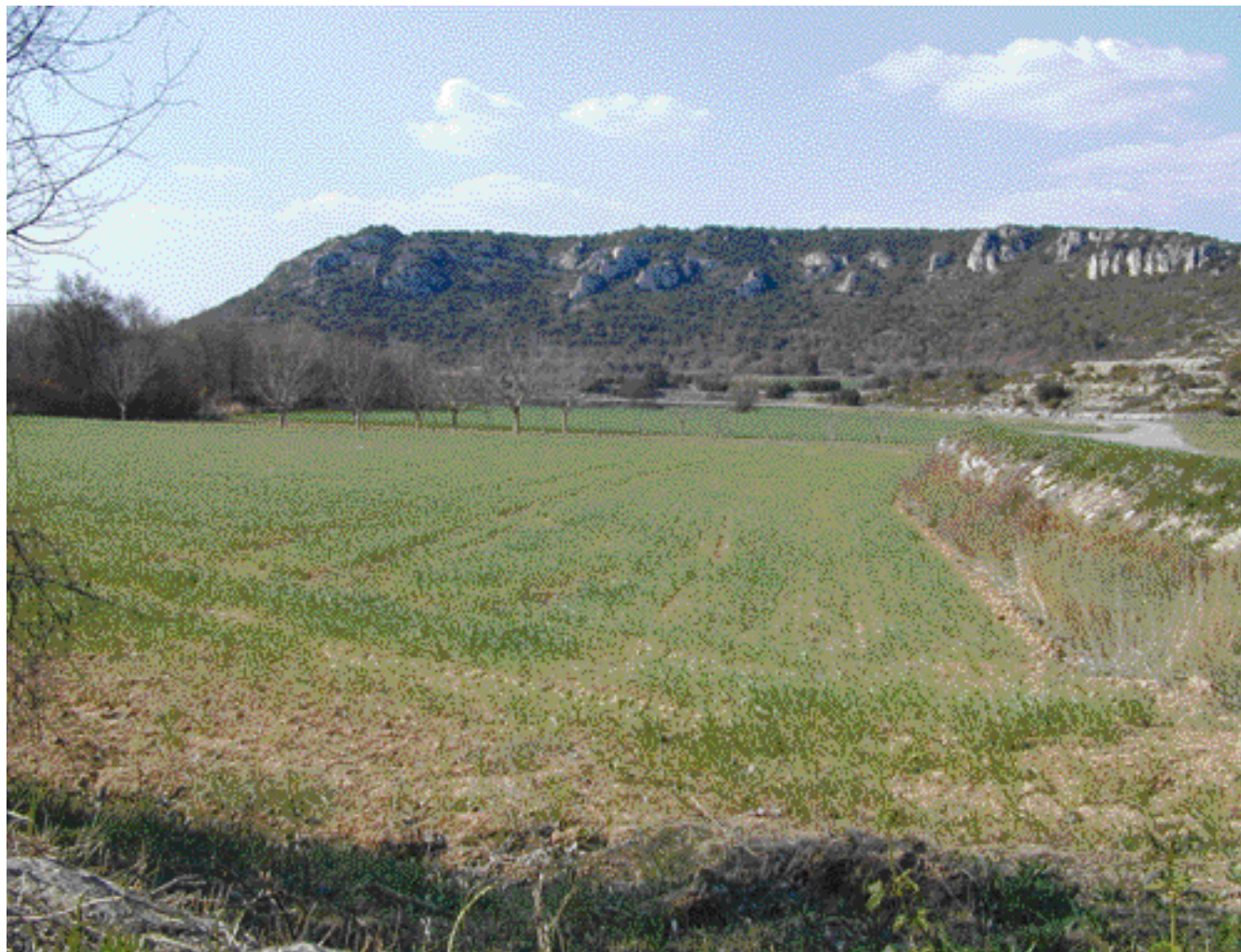
Au coeur de l'unité de paysage, le vallée du Labéou insère quelques champs ouverts entre les versants dominés par les rebords du plateau de Cadarache

Ces paysages en marge n'ont pas, comme leurs voisins, inspiré les peintres ou les écrivains.