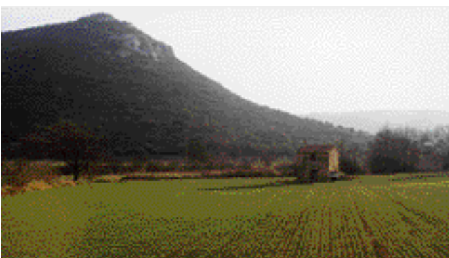
Cabanon au pied de la colline San-Peyre, un paysage remarquable

Le paysage de la vallée est structuré en larges parcelles séparées par les bourrelets qui longent les anciens béals d'irrigation.