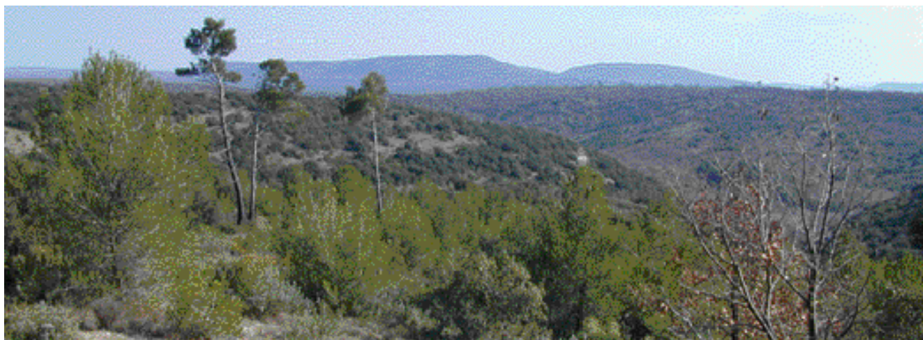
Le rebord Sud-Ouest de la plaine de Grassy