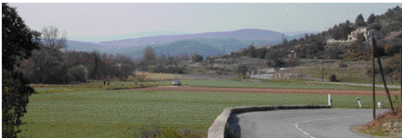
Le vallon du Labéou à l'Est de Saint-Paul-lez-Durance

Le centre est bien visible mais inaccessible, protégé par les clôtures et les barrières qui coupent les routes.