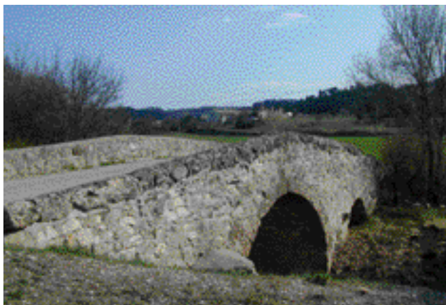
Le vieux pont de Mallabé*