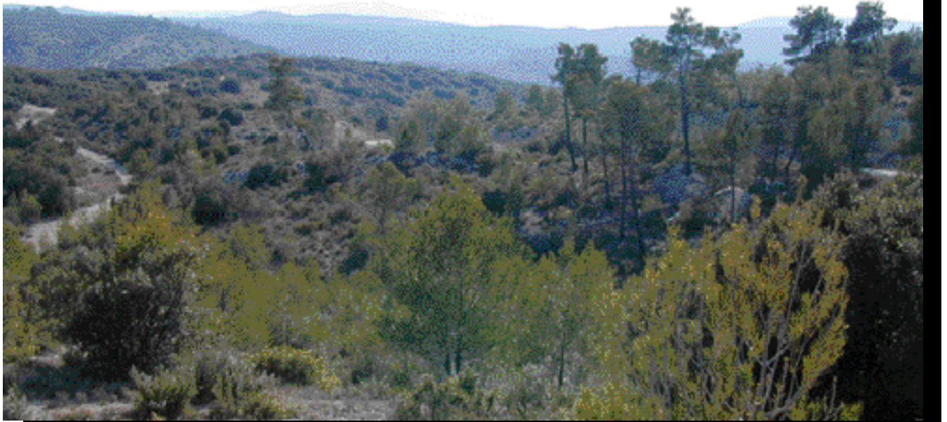
Le paysage remarquable de la haute vallée du Labéou et des plateaux : vue vers le Sud-Est