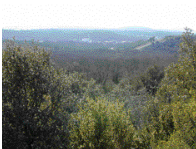
Le site de Cadarache depuis le plateau de Mourre