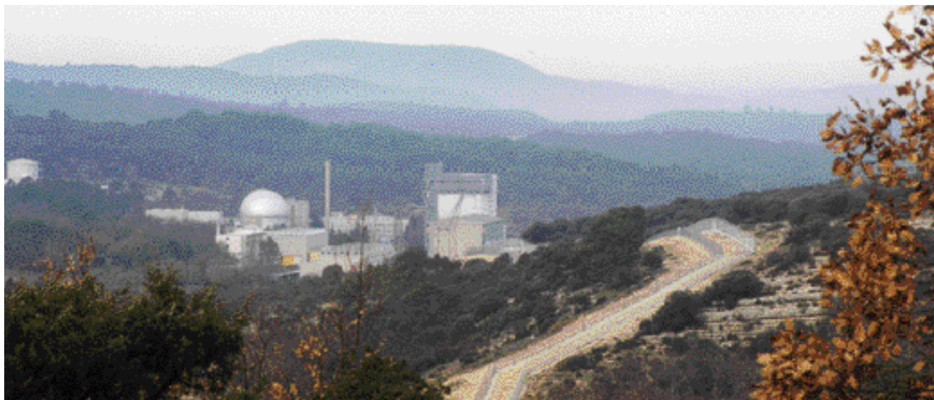
Le Centre de Cadarache depuis la RD 11a en février 1998 (prise de vue zoomée)