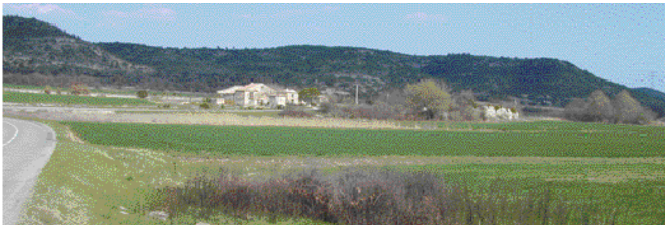
Le paysage remarquable du terroir du mas de Mallabé