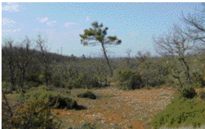
La chênaie blanche de la plaine de Grassy