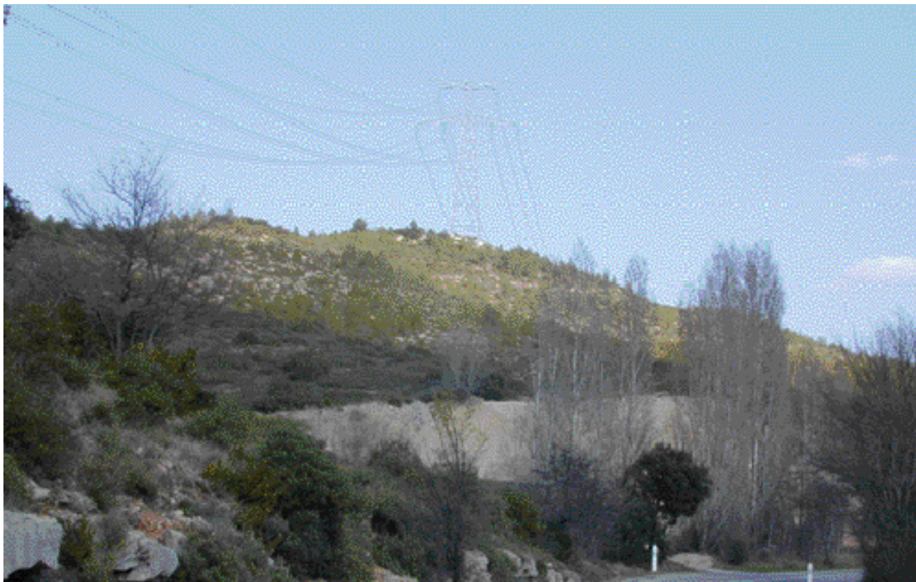
Ligne THT et ancienne carrière dans la haute vallée

• Une ancienne carrière marque les abords de la route dans la haute vallée.