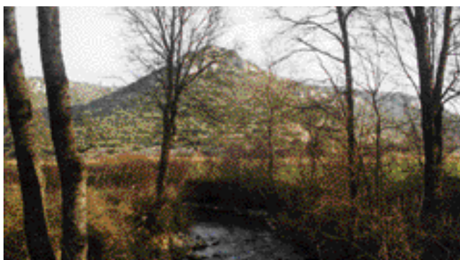
La ripisylve du ruisseau du Labéou en hiver

Actuellement, le terroir cultivé se limite à de petites enclaves sur les collines et à des chênes truffiers sur le plateau dans la vallée du Labéou.