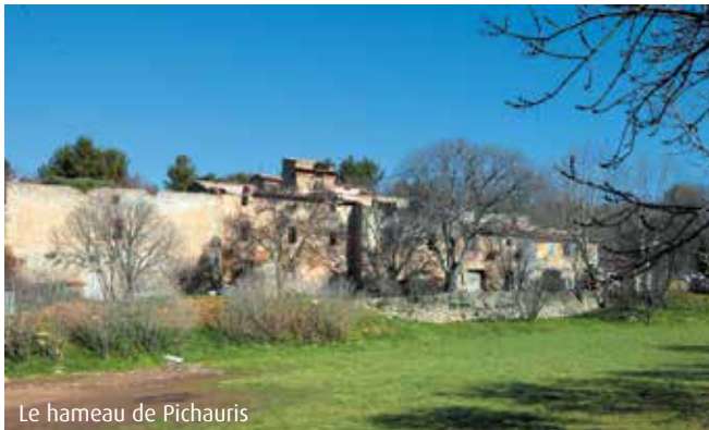
Le hameau de Pichouris

Il ne reste aujourd'hui que quelques ruines du château, interdites au public pour des raisons de sécurité.